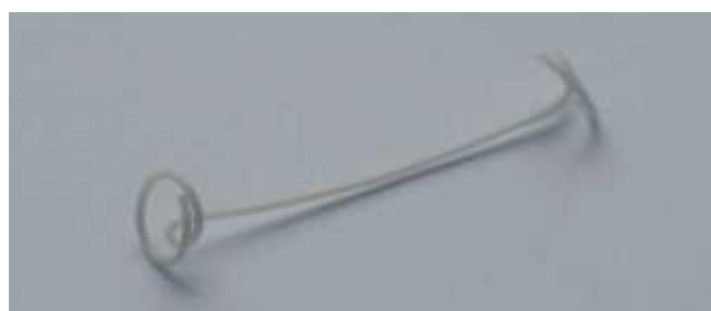
Рис. 4. Общий вид стента для шунтирующих операций при пороках развития мочевыделительной системы плода, разработанный сотрудниками Уральского научно-исследовательского института охраны материнства и младенчества