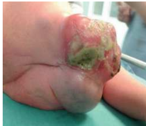
Рис. 2. Крестцово-копчиковая тератома у новорожденного после коагуляции сосудистой ножки тератомы в сроке 22 недели беременности

Нами проведены 27 шунтирующих операций почек плода при обструктивных поражениях мочевыводящего тракта у 19 пациенток с положительным эффектом. Показаниями для оперативной коррекции патологии мочевого выводящих путей плода стали синдром задних уретральных клапанов, двусторонние/односторонние гидронефроты