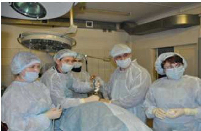
Рис. 1. I этап эксперимента по коррекции спинномозговой грыжи.

Показаниями к внутриутробному лечению послужили: